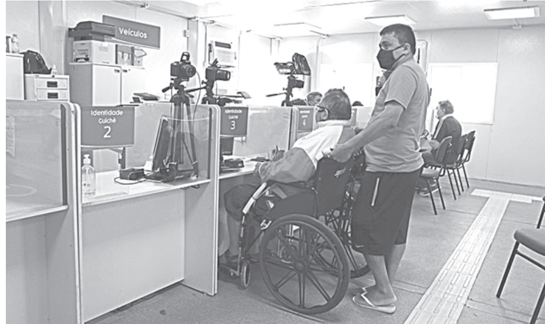
Não há cobrança de taxas para emissão de carteira de identidade e renovação da habilitação a público PCD

Além do requerimento, o usuário precisa apresentar cópias de identidade, CPF e comprovante de residência. Nos casos de renovação da CNH, precisa ser apresentada a carteira vencida. O processo administrativo deve ser aberto na sede do Detran, no Centro do Rio, e também nas Ciretrans e nos Sats.