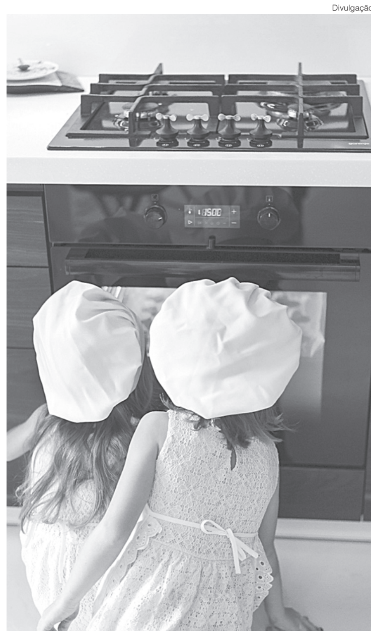
Com uma média de 53 registros de acidentes por queimadura por dia, médico salienta dicas de prevenção