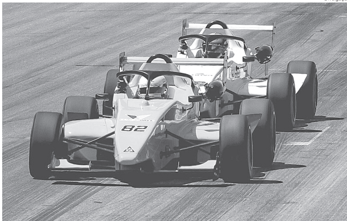
Mageste corre por Volta Redonda nas pistas reais e também nas virtuais

competido profissionalmente no Automobilismo Virtual, representando a equipe real da Stock Light e TCR South America, W2 ProGP, e atuado com Coach de alguns Pilotos em categorias relevantes.