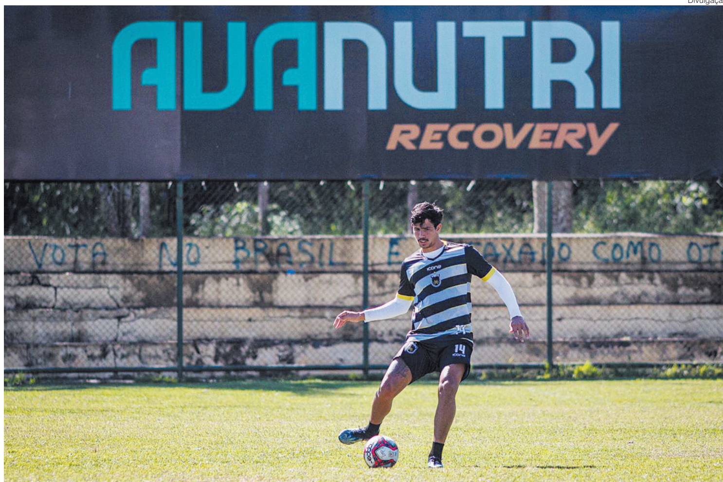
'Vamos entrar para fazer um grande jogo diante do Floresta, usar o fator casa a nosso favor e conquistar estes três pontos que nos recoloca no G4', disse o zagueiro

- Quando cheguei, o grupo me recebeu super bem. Consegui conquistar o meu espaço, a minha oportunidade, e vou seguir trabalhando firme e forte para continuar ajudando meus companheiros dentro de campo. A nossa defesa vem muito bem na competição, já completamos três jogos sem tomar gol, somos a menos vazada do grupo, e isso traz uma confiança grande para todo o nosso sistema defensivo, que vem jogando muito, independentemente de quem entra. É continuar focados, conversando bastante ali atrás para mantermos este bom nível e ajudar a equipe a conquistar as vitórias – destacou.