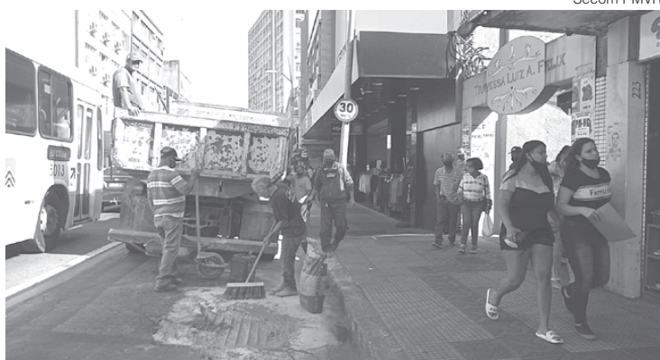
Aterrado e Centro foram beneficiados pelo projeto 'Reconstruindo VR' nesta semana

Nos bairros Vila Brasília, na Rua C1, e no Jardim das Américas, foi executado o serviço de limpeza e co-