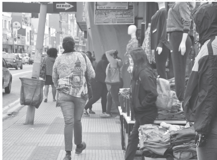
Comércio de Volta Redonda volta a funcionar em horário normal

que o comércio já começa a se preparar para as vendas do Dia dos Pais e poder ter um horário mais flexível para trabalhar ajuda, inclusive, na antecipação por parte do consumidor, que poderá se programar melhor para comprar os presentes com mais calma. “Quem precisa ir mais cedo ao comércio, por exemplo, vai ter mais tempo”, comentou.