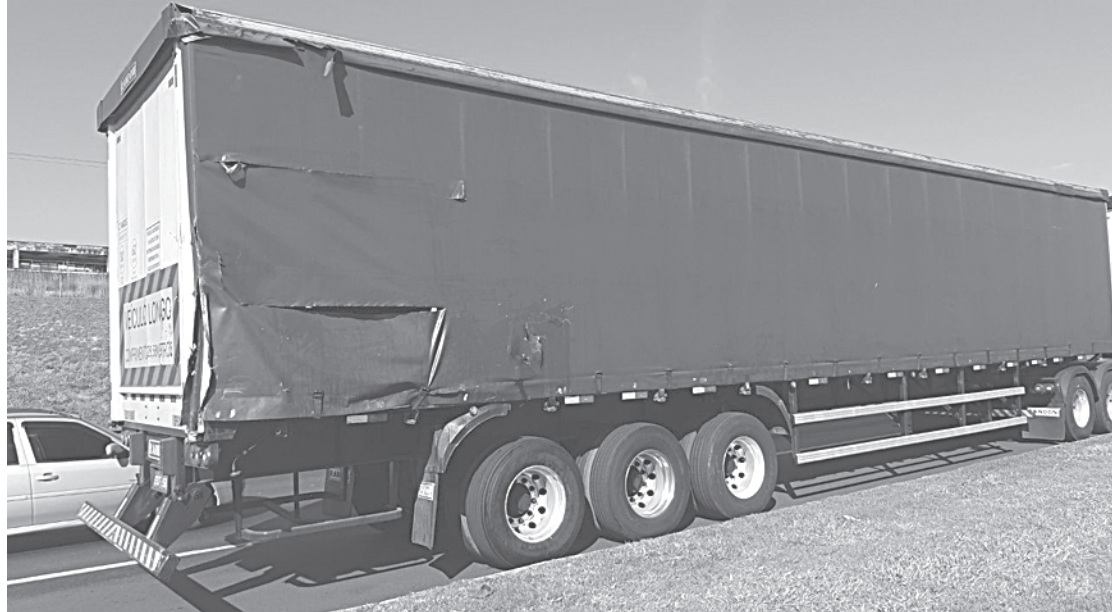
Acidente entre duas carretas foi na altura do km 298

Policiais rodoviários federais informaram que a equipe da 7ª DEL PRF apurou, no local, que a vítima colidiu na traseira da outra carreta, enquanto seguia viagem. Após o ocorrido, o condutor ferido foi encaminhado pela equipe de resgate da Nova Dutra ao Hospital de Emergência de Resende. Não há informações sobre seu estado de saúde.