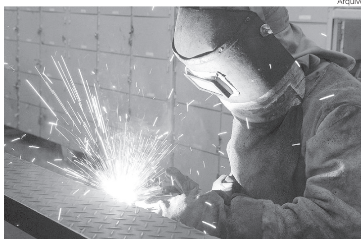
Alta foi puxada por expansão de 29,3% nos investimentos

A alta de 9,7% do trimestre encerrado em maio deste ano, na comparação com o mesmo período de