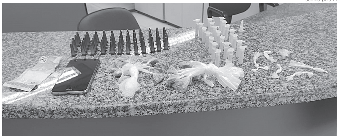
Drogas apreendidas no Minerlândia com suspeito são levadas para a delegacia

Ele, no entanto, foi dominado e levado para a delegacia. Os agentes investigam participação do suspeito em um assalto ocorrido recentemente no bairro Conforto, em Volta Redonda.